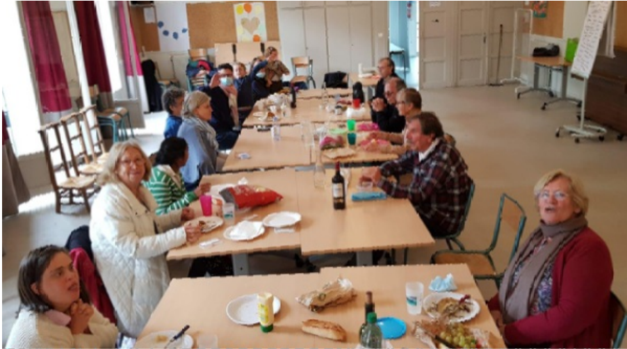
La communauté Graine de Moutarde (Ville d'Avray, 92), en effectif réduit.

Dur dur de garder son masque particulièrement pour les membres porteurs d'un handicap. Même si nos réunions sont déconseillées, il est possible de trouver des alternatives :